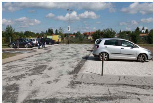
16.30 – Óvoda előtti parkoló átadása