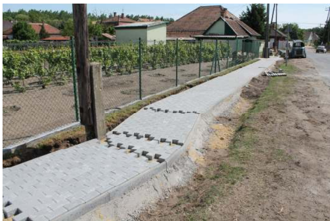
15.30 – Jókai úti járda átadása

Az óvoda dolgozói a jelenlévőket szendvicsekkel és süteményekkel látják vendégül.