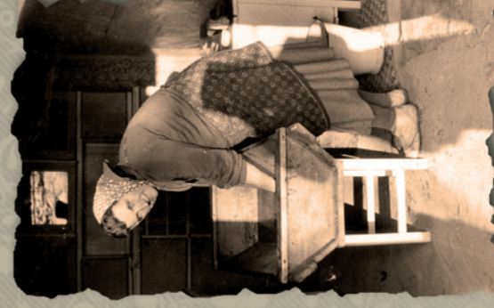
Minden Kedves Olvasónknak Boldog Új Esztendőt Kívánunk!