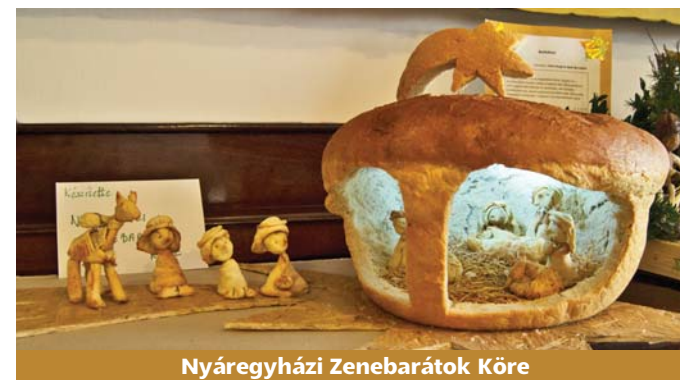
Nyáregyházi Zenebarátok Köre