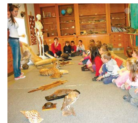
Előadás a Természettudományi Múzeumban

Október 17-én a nagycsoportosokkal „tanulmányi” kiránduláson voltunk a Magyar Természettudományi Múzeumban. A szépen felújított, új kiállításokkal gazdagított intézményben rengeteg érdekes és izgalmas felfedeznivalót találtunk a gyerekekkel. A hagyományokhoz híven, az idén is részt vettünk egy múzeumpedagógiai foglalkozáson, ami nagy sikert aratott az óvodások körében. Itt ugyanis, lehetővé vált megfogni, megsimogatni, testközelből megismerlni, tanulmányozni a kitalált állatokat, prémekeket, tollakat,