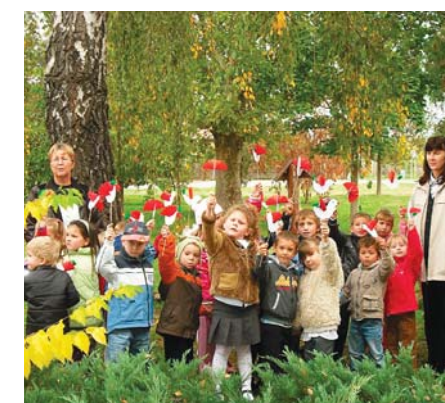
Megemlékezés a Hősök terén

Október 24-én óvodáscsoportjainkkal kísérteltünk a Hősök terére, ahol egy rövid kis megemlékezést követően, a gyermekek ünnepi versekkel, énekekkel, valamint az általuk készített nemzeti színű zászlócskákkal tisztelegtek a forradalom hősei előtt.