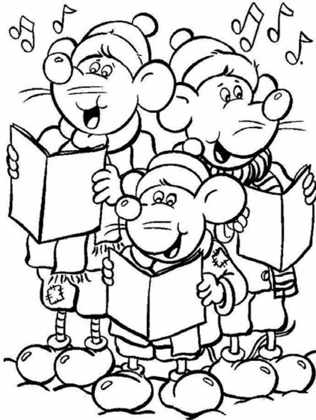
A kép kiszínezhető!

Mit is jelent ez a gyakorlatban? „...mindannyian meghívtátok arra, hogy elfogadjuk [az Úr] hívását: lépünk ki kényelmességünkből, és legyen bátorságunk eljutni az összes perifériára, ahol szükség van az Evangélium fényére.” (nr. 20). Lehet, hogy eközben az „utca sara összepiszkol minket” (nr. 45), ugyanakkor, ha nem vállaljuk fel ennek veszélyét, abba belebetegszünk. Az egyik karácsonyi himnusz ezt így írja le: „Az égi kórus ünnepel, dicséri Istent víg dala, a pásztorok közt megjelent a nagy Mindenség pásztorja.”