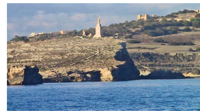
Málta – Pál hajótörésének színhelye, 2013