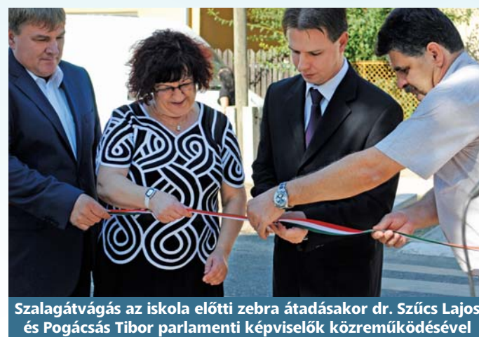
Szalagátvágás az iskola előtti zebra átadásakor dr. Szűcs Lajos és Pogácsás Tibor parlamenti képviselők közreműködésével

Februárban kezdődött el a faluközpontban lévő régi Községháza felújítása, és a hozzá tartozó zöldfelület rendezése. A 2010 óta múzeumként működő épület „rendbetételére” a falumegújításra- és fejlesztésre igénybe vehető támogatásokból sikerült 9.798.520 forintot elnyernünk.