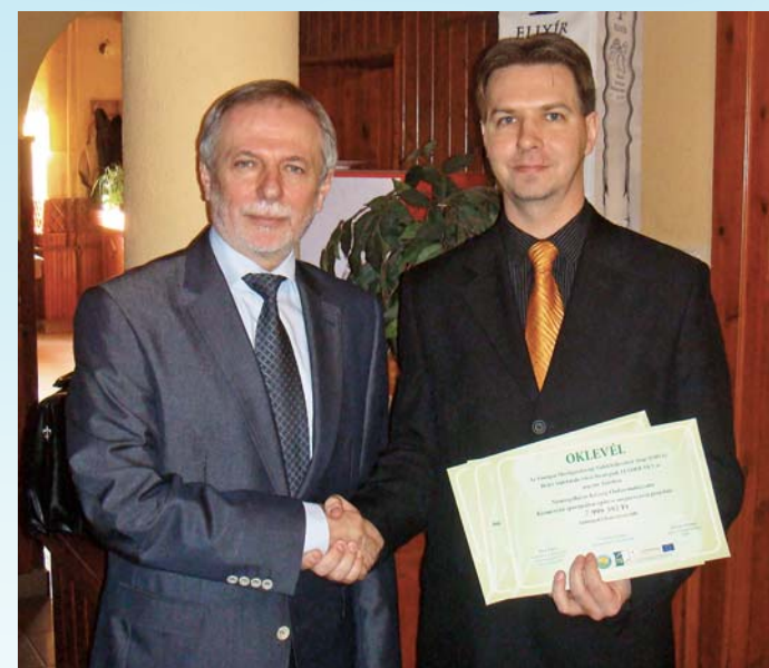
Czerván György államtitkárral a Leader pályázatok elnyerését követően

Idén számos olyan fejlesztés, építkezés, felújítás valósul meg településünkön, melyekre az elmúlt évben sikeres pályázati támogatást szereztünk. Hamarosan indul a szennyvízberuházás II. üteme, és eredményesen lobbiztunk a nemrég megvalósult útfelújításért is. Célunk, hogy fejlettebbé, élhetőbbé, szebbé tegyük közös otthonunkat, Nyáregyházát.