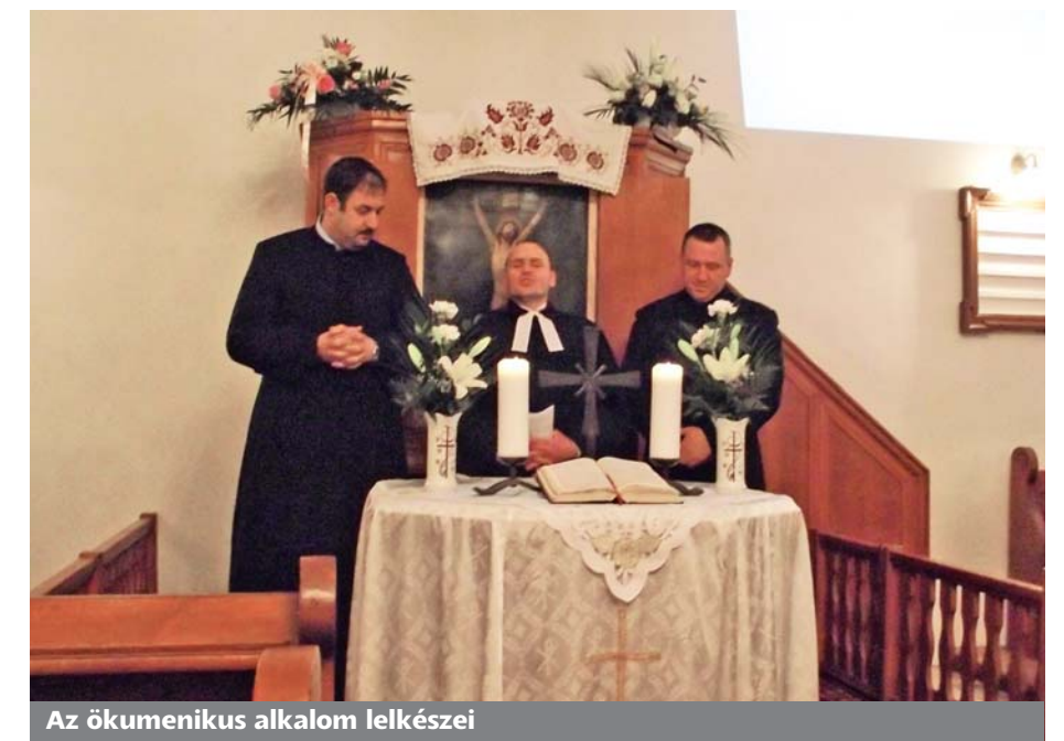
Az ökumenikus alkalom lelkészei

testvéreket, biztosan nagy szeretettel és gazdagon terített asztallal várták a másik két felekezet tagjait. Jó dolog az ökumenizmus, az egymás felé való közeledés, a legtöbben ezt érezzük és teszünk azért, hogy ezek az alkalmak létre jöhessenek.