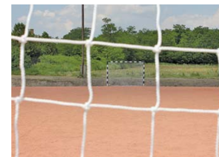
A Felsőnyáregyházán kialakított kisméretű sportpálya

Meg lehetne saját forrásból is, de pályázat útján érdemes. Nagyon kevés önkormányzat tud ilyen mértékű beruházásokat saját maga megfinanszírozni, általa-