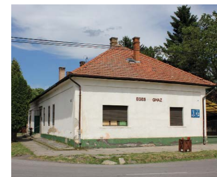
Egészségház – ráfér a felújítás

tartó eszközöket szereztünk be, és folyamatban van a vízvételi helyek kialakítása, hogy a pályát locsolni tudjuk. Átadását júliusban tervezzük. A Kaszner Margit Múzeum falújítása befejeződött, az átadás időpontja egyeztetés alatt áll. Az információs- és üdvözlőtáblák beszerzése folyamatban van. Hamarosan elkezdődik az Egészségház és a Polgármesteri Hivatal energetikai korszerűsítése, jelenleg a kivitelező kiválasztása zajlik. A beruházáshoz önerő-támogatást is nyertünk, így néhány olyan felújítást is elvégzünk majd, amelyek ugyan a pályázatban nem elszá-