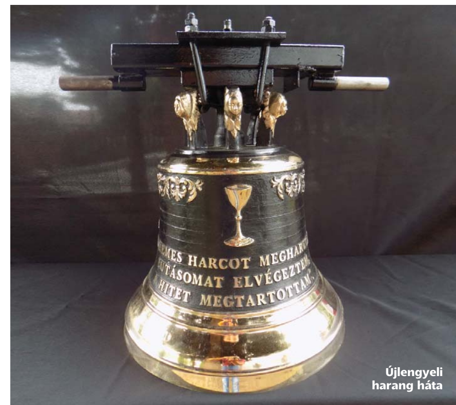
Újlengyeli harang háta

A Gyülekezetünkről bővebb információ található a gyülekezet honlapján, cikkeiben és fotótárában: http://refnyaregyhaza.fw.hu