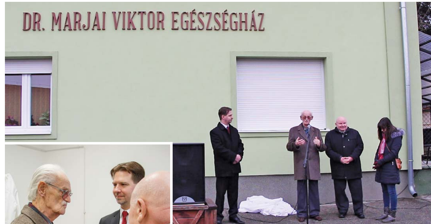
A felirat leleplezése után