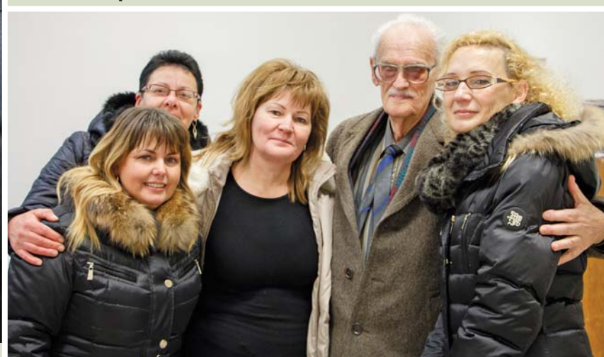
Az egészségügyi ellátásban dolgozó hölgyekkel