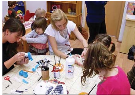
Nyílt nap a Napsugár csoportban