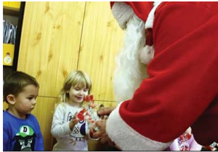
Mikulás a Napsugár csoportban

Kedves Olvasók! Mint mindig, az elmúlt évben is örömteli készülődéssel telt az adventi időszak óvodánkban. A gyerekek énekeket, verseket tanultak, a szülők nyílt napokon bepillantást nyerhettek óvodai életünkbe.