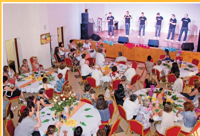
Óvodai, iskolai, egészségügyi és hivatali munkatársak köszöntése