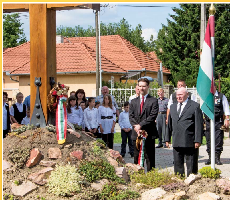
Koszorúzás a Trianoni Emlékkeresztnél