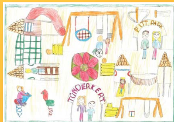
Rajzpályázat I. helyezett – Dancsó Nadin Dóra, 4. évf.