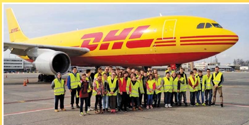
Kirándulás a Liszt Ferenc nemzetközi repülőtérre