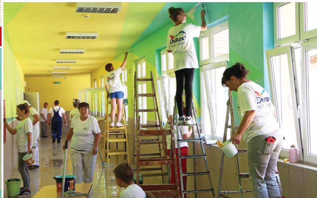
Új színvilág az iskola emeleti folyosóján