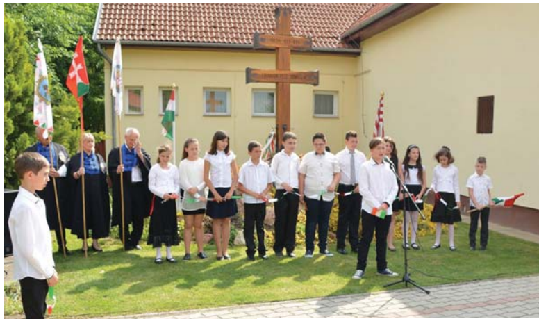
A diákok műsora az Összetartozás Napján