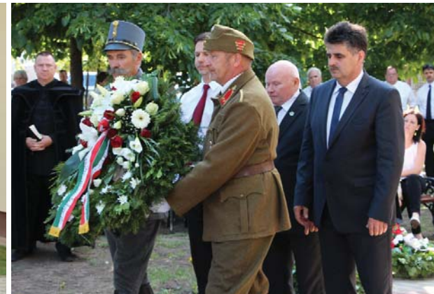
Pogácsás Tibor államtitkár úr koszorúzása