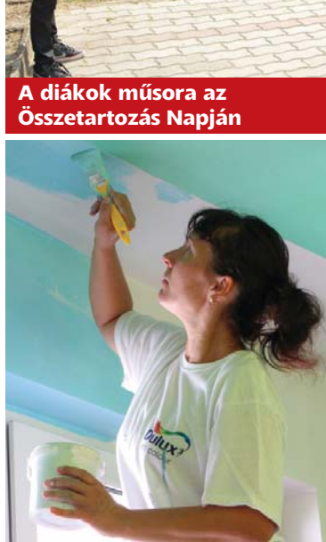
A kontúroknál kézügyes-ségre is szükség volt