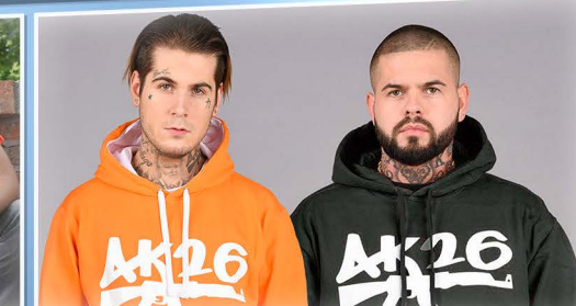
SZ / 18:00 AK26