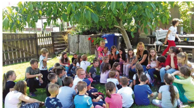
Kis pihenő egy diófa árnyékában a Vöröskeresztes Napközi Táboron