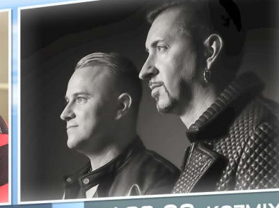
P / 23:00 KOZMIX