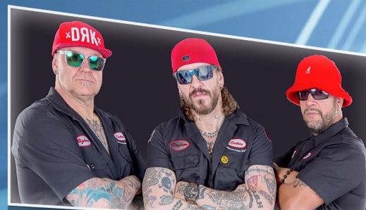
P / 21:30 GANXSTA ZOLEE ÉS A KARTEL