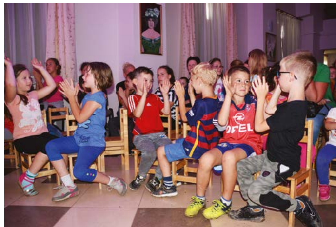
A gyerköcök jól szórakoztak az előadás közben