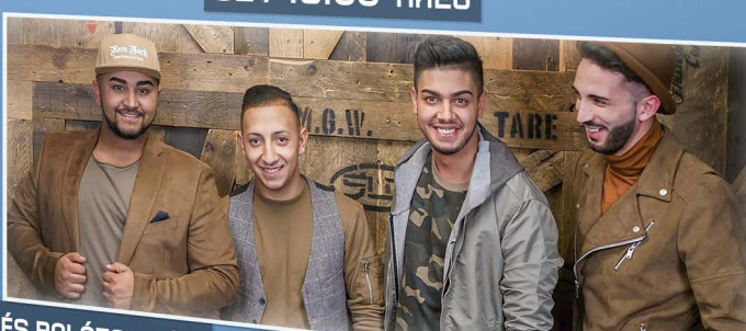
SZ / 22:30 HAM KO HAM

Motoros találkozó és felvonulás Generation of Legends bemutató Western kaszkadőr show Játszóház | Baleseti szimuláció Kiállítások | Retro Disco