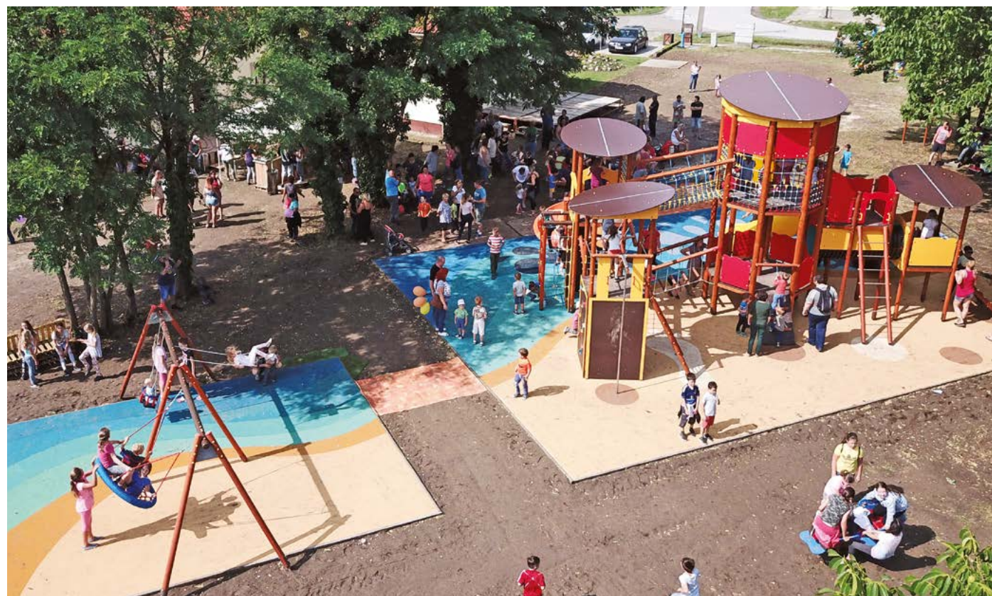
Rendkívüli gyermeknap játszótér átadással egybekötve