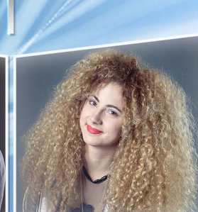
P / 19:00 OPITZ BARBI