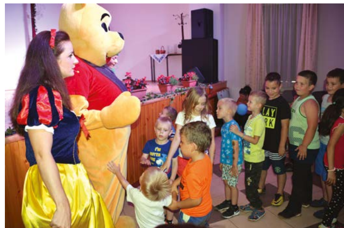
Gyermekműsor közben a művelődési házban