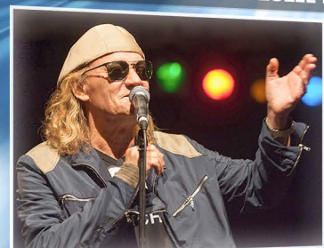
P / 20:00 CHARLIE